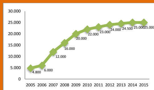
Superficie de olivos plantados en Chile en el periodo 2005-2015.